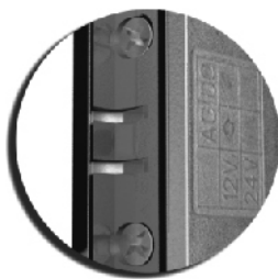
Wewnętrzna strona języka z wyslizgiem

Specjalna konstrukcja mechanizmu języka oraz wyslizgu zapadki zamka w obudowie powoduje otwarcie przy minimalnym wychyleniu. Umożliwia to montaż elektrozaczepu bez podcinania ościeżnicy od czoła drzwi. Uniwersalne (lewe, prawe), symetryczne, dostępne według tabeli. Regulacja języka w zakresie 3 mm. Rozstaw śrub montażowych 52 mm.