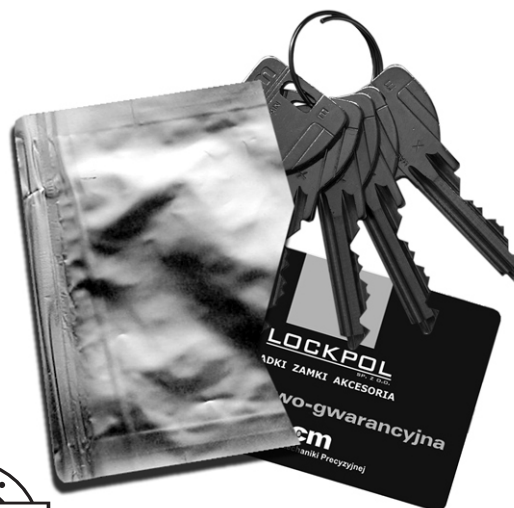
Zabezpieczone klucze i karta kodowa

Zabezpieczenie kodu: Klasa 6 (najwyższa) Odporność na atak: Klasa 2 (najwyższa) Odporność na włamanie: Klasa B